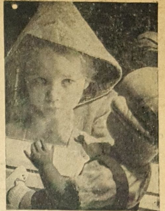
SEHNSUCHT KLEINER HERZEN „Ach, wenn ich doch Weihnachten eine so schöne Puppe bekäme...!“

Er kniff die Lider zusammen, und obwohl er nichts entdecken konnte, war er davon überzeugt, daß der alte Andreas auch dort oben eine seiner seltsamen Minuten verborgen hielt.