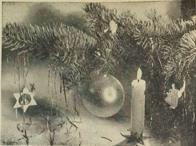
Weihnachten ist nicht mehr weit.

Ja, es war meine Waffe, aus der man auf Ives Stipanovic geschossen hatte. Das konnte