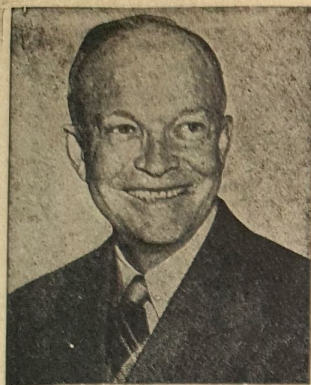
Eisenhower nach dem Siege

Die mit 1270 Mann höchsten Wochenverluste im koreanischen Krieg seit einem Jahr meldet das Verteidigungsministerium der Vereinigten Staaten. Damit sind die Gesamtverluste seit Kriegsbeginn auf 123 395 Mann angestiegen. Die UNO-Vollversammlung, auf deren Eingreifen in der Koreafrage man gerechnet hatte, konnte bis jetzt mit einem positiven Ergebnis nicht aufwarten. Es wird wohl von Geheimverhandlungen gesprochen, die besonders auf Initiative der indischen Delegation zurückzuführen, doch ist lediglich eine dreistündige Rede Wyszynski zu vermerken, die in dem Vorschlag der Bildung einer Untersuchungskommission gipfelte. Die neueste Nachricht aus dem Waffenstillstandslager an der Front erwähnt einen Geheimbrief des nordkoreanischen Chef-Delegierten General Nam Il. Er soll sich mit der leidigen Frage der Repatriierung von Kriegsgefangenen befassen. Da die USA in diesem Vorschlag eine Falle vermuten, haben sie das Schreiben noch nicht veröffentlicht.