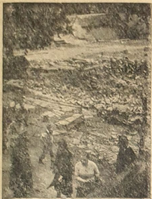
Tote Zone im Herzen Deutschlands