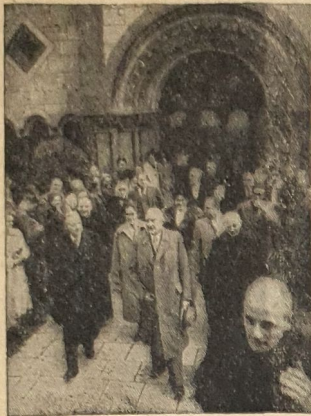
De Gasperi besuchte Maria Laach

Die Kartoffelernte besser als erwartet - Was bringt der Bundeshaushaltsplan?