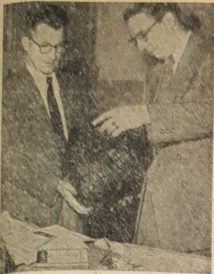
Deutsche Wissenschaftler erforschen El Salvador

Erscheint vorerst einmal in der Woche (Sonnabends) Bezugspreis (voranzahlbar) monatlich 1.— DM einschließlich Trügerlohn. Bei Postbezug 1.— DM zuzüglich 0,27 DM Zustellgebühr. Druck und Verlag: Buchdruckerei Hugo Munzer, Spangenberg. Verantwortlich: Hugo Munzer Spangenberg. — Telefon: 234, Telegr.-Adr.: „Zeitung“