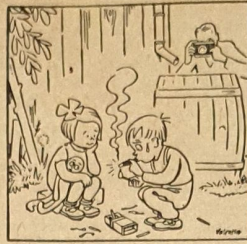
Nicht ärgern — knipsen!

Freiwillige Feuerwehr Spangenberg Sonntag, den 31. August, 7.30 Uhr Übung. Antreten am Gerätehaus — Übung auswärts. Pünktliches Erscheinen wird erwartet. Der Ortsbrandmeister.