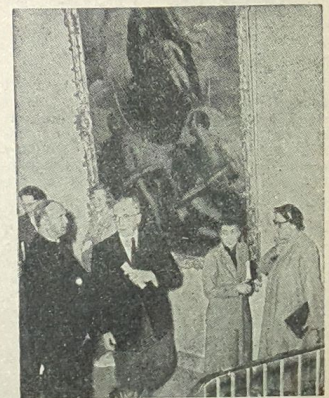
Welfenschatz-Ausstellung wurde eröffnet