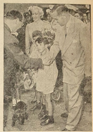
Hochkommissar Donnelly in Bonn In Begleitung seiner Gattin und seiner beiden Kinder traf der neue Hochkommissar in Deutschland, Walter Donnelly, in Bonn ein.

Bundeswohnungsbauminister Dr. Neumayer will nach den Ferien dem Kabinett einen Reformplan für den Wohnungsbauprogramm vorlegen, der einheitliche Richtlinien für Bund, Länder und Gemeinden vorsieht. An den bewährten Methoden des verstorbenen Bundeswohnungsbauministers Wildermuth soll festgehalten werden, aber es wird eine straffere Lenkung in der technischen Leitung angestrebt. In Bonn hofft man, auch in diesem Jahr wieder 350 000 Wohnungen herstellen zu können. Einen wichtigen Platz in der Reform wird die angestrebte Erhöhung des Mietpreises aus einnehmen, die nicht nur im Interesse der Erhaltung des Hausbesitzes für notwendig gehalten wird, sondern auch, um in verstärktem Maße private Mittel für den Wohnungsbau frei zu bekommen. Eine allgemeine Mieterhöhung (mit Ausnahme für Neubauten) wird jedoch erst nach harten parlamentarischen Kämpfen durchgesetzt werden können.