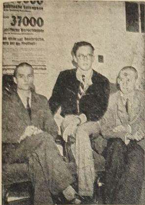
Aus Zwickau befreit

Zwei Wochen lang haben die sportlichen Großereignisse in Helsinki das Weltinteresse magisch auf sich gezogen. Ein bisher einmaliges Aufgebot von Männern der Presse, des Rundfunks und der Photographie haben es erreicht, daß allüberall die Olympiapfanzen gehört werden. Vom deutschen Standpunkt aus waren die Erfolge unserer Olympiakämpfer nicht ganz so zahlreich, wie wir uns das gewünscht hatten. Es wird Aufgabe der berufenen Stellen sein, aus den Erfahrungen von Helsinki zu lernen. Die Russen haben