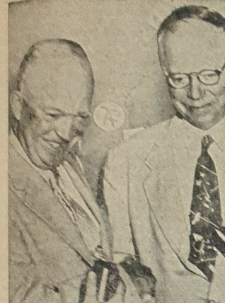
Das Kriegsbeil begraben haben General Eisenhower und Robert Taft, die beiden Rivale um die Nominierung des republikanischen Präsidentschaftskandidaten. Mit der Wahl Eisenhowers ist Taft zum dritten Male bei der Bewerbung als Kandidat der Republikaner gescheitert.

Erscheint vorerst einmal in der Woche (Sontagsabende) Bezugspreis (vorauszahlbar) monatlich 1.— DM einschl. Trägerlohn. Bei Postabzug 1.— DM zuzügl. 0,27 DM Zustellgebühr. Druck und Verlag: Buchdruckerei Hugo Munzer, Spangenberg. Verantwortlich: Hugo Munzer Spangenberg. — Telefon: 234, Telegr.-Adr.: „Zeitung“