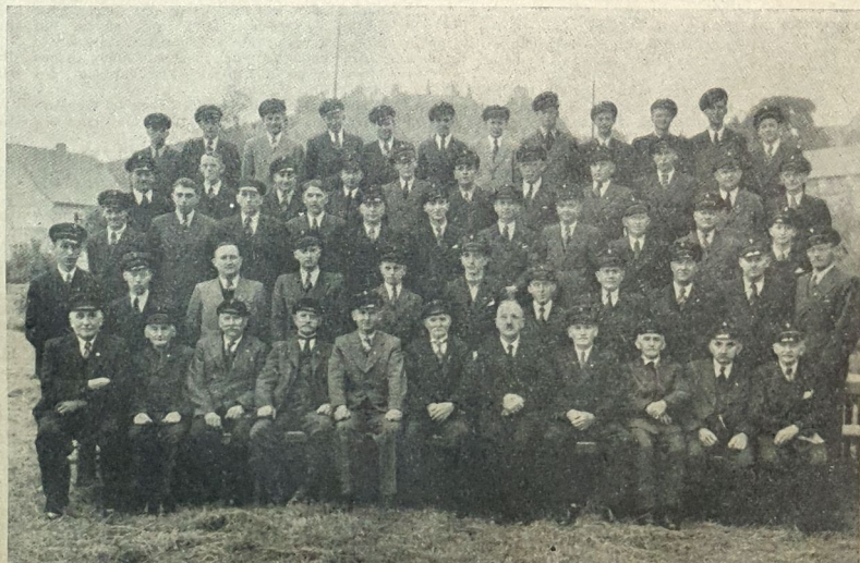
Männergesangverein „Liedertafel“ 1842 e. V. Spangenberg