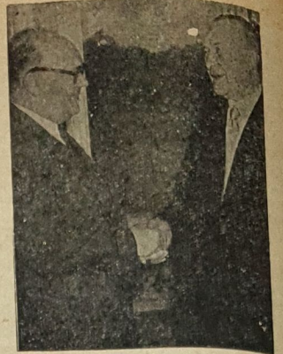
Spaak besuchte Dr. Adenauer Herrn Spaak, der von Bundespräsident Heuss in der Villa Hammerschmidt empfangen wurde, war auch Gast des Bundeskanzlers im Palais Schaumburg.

Auch in Korea hat sich die Situation ungünstig verändert. Die Ausrüstung der Yalu-Kraftwerke hat psychologisch keinen Schock in Peking ausgelöst und nur dazu geführt, die Truppenkonzentration an der Front noch zu verstärken. Ein maßgeblicher