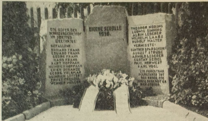
Das Ehrenmal der Schollengemeinde