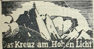
Das Kreuz am Hohen Licht

Copyright by München Roman-Verlag München-Pasing Plötzlich hielt Florian im Blättern inne. Es las eine Zeile, mit großer Schrift ge- schrieben: