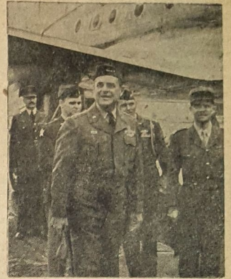
Ridgway in Deutschland eingetroffen

Unter dem Motto: „Schlesien deutsch und ungeteilt“ stand das Bundestreffen der Schlesier in Hannover. Ueber 300 Menschen nahmen hieran teil. Bei dieser Gelegenheit erklärte Bundesminister Jakob Kaiser, die Wiedervereinigung Deutschlands bedeute zunächst nur eine Vereinigung jener Gebiete, in denen deutsche Menschen noch geschlossen leben und wirken. Wenn man an die Befreiung der Sowjetzone denke, dann solle man besser nicht von einer Wiedervereinigung Deutschlands, sondern von der Wiedervereinigung der Deutschen sprechen. Minister Kaiser forderte eine Viererkonferenz, die endlich die endgültige Klarheit über die sowjetischen Absichten bringen müsse.