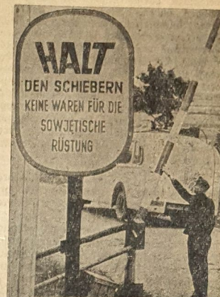
„Halt den Schiebern“

„Stockholm Tidningen“ schreibt: „Glauben die Sowjets, daß sie Herren der Ostsee sind