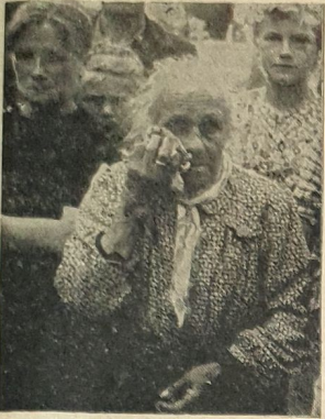
Den Flüchtlingen aus dem Sperrgürtel der Sowjetzonen stehen Furcht und Schrecken noch in den Gesichtern geschrieben. Nun sind sie in Sicherheit, nachdem sie der angeordneten Evakuierung durch die Flucht nach dem Westen entgingen. Sie zogen das Flüchtlingsschicksal in der Bundesrepublik der drohenden Ungewißheit in der Sowjetzone vor.

Erscheint vorerst einmal in der Woche (Sonnabend) Bezugspreis (voranzahlbar) monatlich 1.— DM einsch. Trägerlohn. Bei Postbezug 1.— DM zuzügl. 0,27 DM Zustellgebühr. Druck und Verlag: Buchdruckerei Hugo Munzer, Spangenberg. Verantwortlich: Hugo Munzer Spangenberg. — Telefon: 234, Telegr.-Adr.: „Zeitung“