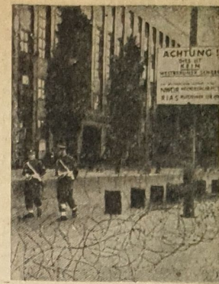
Stacheldraht vor dem Sowjet-Sender

Ich habe bei der letzten Besprechung mit den Gewerkschaftsvertretern zum Ausdruck gebracht, daß ich nach der Bestreikung der großen Zeitungsbetriebe in den letzten Tagen die mir übertragene Aufgabe zu verweigern, als überholt ansehe. Wenn die Gewerkschaften den Weg der planmäßigen Benurhung des öffentlichen Lebens fortsetzen sollten, dann werden die christlichen Arbeitnehmer eine Gewissensentscheidung zu treffen haben. Es ist nicht unbekannt geblieben, daß man in gewissen Kreisen der Gewerkschaften sogar mit dem Gedanken des Generalstreiks spielt. Sollten aber die Gewerkschaften ihre einseitige Politik in einer Zeit schwerwiegender