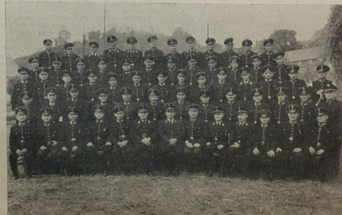
Freiwillige Feuerwehr Spangenberg

1. Der Großbrand in der Jägergasse am 4. September 1883. Es brannten 10 wertvolle mittelalterliche Häuser infolge katastrophalen Wassermangels ab.