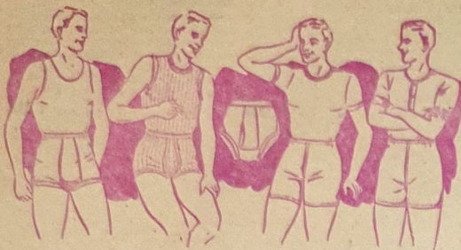
Art. 2200 Art. 2201 Art. 2253 Art. 2202 Art. 2201 Art. 2202