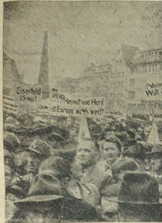
Vertriebene protestierten in Bonn Etwa 50 000 Heimatvertriebene aus allen Teilen des Bundesgebietes und Westberlins demonstrierten am Sonntag auf dem Bonner Marktplatz gegen den Lastenausgleichsgesetz-Entwurf in der jetzigen Form. Unser Bild zeigt einen Blick auf den Bonner Marktplatz während der Rede Dr. Kathers, des BvD-Vorsitzenden.

In einem kleinen Ort der französischen Schweiz lebt ein genialer Schafhirt, dem es verleidet war, daß seine Schafe nächtlicherweise auf der Straße immer wieder angefahren oder sogar überfahren wurden. Nun hat er sich von einem Fahrradhändler 130 Velo-Rückstrahler kommen lassen, die er seinen Schäflein an die Schwänze montierte. Eine Herde mit 130 schwanzelnden Leuchtschwänzen wird auch ein betrunkener Automobilist nicht übersehen können.