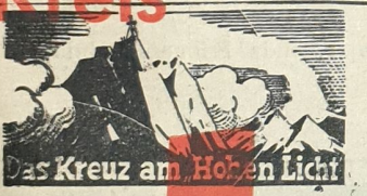
Das Kreuz am Hohen Licht

„Ja“, sagte der Florian langsam, „es wird schon alles gut werden.“ Dann nahm er Lorettas Gesicht zwischen seine Hände und küßte sie auf den Mund. Sie schauten noch eine Weile wortlos in das Tal hinab, tranken Wasser vom Brunnen und machten sich wieder auf den Weg. Hätten sie sich, als sie etwa fünfzehn Meter vom Haus entfernt waren, plötzlich umgesehen, dann wäre ihnen wohl kaum entgangen, daß aus dem Dachkammerfenster der Sennhütte ein Gesicht blickte, dessen Augen ihnen wehmütig nachschauten.