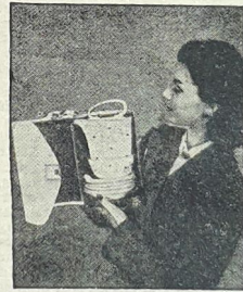
Das Service besteht aus 6 großen Bechern für Kaffee, Tee, Limonade, Eis, Grog, Punsch

Porzellan-Service in der Handtasche Anlässlich der Neuheitenschau auf der Frühjahrsmesse in Hannover brachte die Rosenthal-Porzellan AG. u. a. unter der Bezeichnung „20:1“ ein „Service in der Handtasche“ heraus, das aus 20 Teilen besteht und in einer aufklappbaren kleinen Handtasche bequem, staub- und bruchsicher untergebracht werden kann. Als Handtaschen-Griff dient, wie unser Bild erkennen läßt, der als Patentverschlus ausgebildete Deckel der Kaffeekanne. Die beiden in der Längsrichtung durch Scharniere zusammengehaltene Teile der kleinen Handbox werden durch ein seitlich angeordnetes Schloß fest und sicher zusammengehalten.