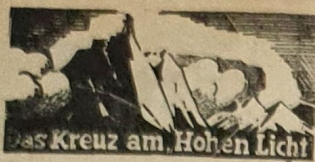
Das Kreuz am Hohen Licht