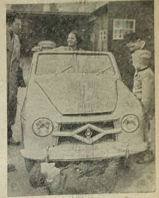
Ein Auto „nach Maß“ Ein Krefelder Karosseriemeister baute sich ein Auto, das als Zweisitzer-Sportkabriolet eine Stundengeschwindigkeit von 85 bis 100 Kilometern erreicht. (dpa)

Auf dem Gebiet der Innenpolitik ist das Verfahren gegen Auerbach wichtig. Dieser bisher größte kriminelle Prozeß der Nach-kriegszeit rollt in München ab. Die Verhand-lungen gegen den ehemaligen Präsidenten des Ph. bayerischen Landesentschädigungsamtes, Ph. Auerbach, erregten dort lebhaftes Interesse. Der Angeklagte war am 10. März 1951 ver-haftet worden. Monatlang haben anschlie-ßend rund 50 Kriminalbeamte tagaus, tagein in den Räumen des Landesentschädigungs-amtes gearbeitet. Eine Viertelmillion Akten-stücke wurden beschlagnahmt, und das Ergeb-nis der Voruntersuchungen ist eine 104 Seiten starke Anklageschrift. Sie legt Auerbach fol-gende Vergehen zur Last: Schwere Amtsunter-schlagung, Erpressung, Untreue, Betrug, pas-sive Bestechung, Abgabenüberhebung, Abgabe wissenschaftlich falscher eidesstattlicher Erklä-rungen, unbefugte Führung eines Dokortitels, Vergehen gegen das alliierte Währungsgesetz und gegen das Sammlungsgesetz.