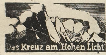
Copyright by München Roman-Verlag München-Pasing Fortsetzung von Seite 4.