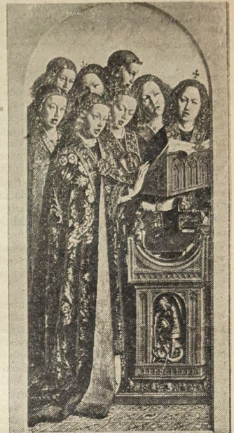
DAS BILD DER SINGENDEN ENGEL, ein Teil des berühmten Genter Altars der Brüder Hubert und Jan van Eyck, läßt uns in der Karwoche schon den Jubel des Osterfestes ahnen.

In Budapest finden zurzeit Feiern zum 7. Jahrestag der Einnahme der Stadt durch die Rote Armee statt. Alle Anzeichen sprechen dafür, daß die offiziellen Feierlichkeiten nur den äußeren Rahmen für eine Veranstaltung bilden, die hinter den Kulissen stattfindet, nämlich eine Tagung des Kominform. Prominenteste Politiker aus Sowjetrußland, Rottchina, Korea, der Mongolei, Polen, der Tschechoslowakei, Rumänien, Bulgarien und Ostdeutschland werden in der ungarischen Hauptstadt. Dort werden, so darf man annehmen, die nächsten Maßnahmen der Kremelpolitik beraten. Interessierte Beobachter wollen sogar wissen, daß dort eine neue Deutschlandnote des Kremls vorbereitet wird. Man darf also annehmen, daß nach den Osterfeiertagen der weltpolitische Kampf zwischen Moskau und Washington mit verstärktem Einsatz fortgeführt wird.