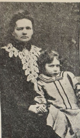
Marie Curie, die Entdeckerin des Radiums, mit ihrem Töchterchen Irène, der jetzigen Frau Joliot Curie. Ihr gelang 1904 die künstliche Herstellung radioaktiver Elemente.

Aus Joachimsthal in Böhmen bezog Maria Curie ihren Rohstoff. Dort lagen als Abfallstoffe Umengen von Pechblende. Die Joachimsthaler waren froh, das Zeug los zu sein. Sie bekam es für umsonst. Nur die Fracht mußte sie bezahlen, und das war schon ein erger Riß in den ohnehin schmalen Beutel der Curies, die jeden Sous in ihre Arbeit steckten. Es war eine schwere Arbeit für einen Mann. Eine viel zu schwere Arbeit für eine Frau! Da war nichts von dem blinkenden Chrom und strahlenden Weiß moderner Laboratorien mit Klimaanlage und weißen Berufsmänteln. Es war eher eine Versuchswerkstatt für Lokomotivheizer. In der zugeigen Halle ohne Fußboden stand die kleine Frau mit schwarzen, rissigen Händen, abgebrochenen Fingernägeln, geschwärztem Gesicht und blaugroener Nase und schleppte tonnenweise die Pechblende herein, die die Speditoren auf den Bürgersteig gekippt hatten. „Seltene Kohlen!“, werden die Pariser Bürger gedacht haben, denn so sah das Zeug aus. Maria verarbeitete es. Sie suchte nach dem Bruchteil eines Stecknadelkopfes in einer Waggonladung voller Dreck. Aus Tonnen machte sie ein Milligramm! Ihr Mann erlitt als Dozent