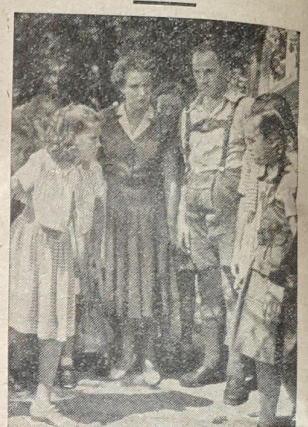
Die erste Begegnung ist nicht gerade freundlich. Eine Szene mit den Zwillingen aus „Das doppelte Leichenhaus“ der Stenbock-Fredel- Produktion. (Das doppelte Leichenhaus). Regie: Josef von Baky.