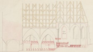
Hohe Fundament in Bild der Kirche