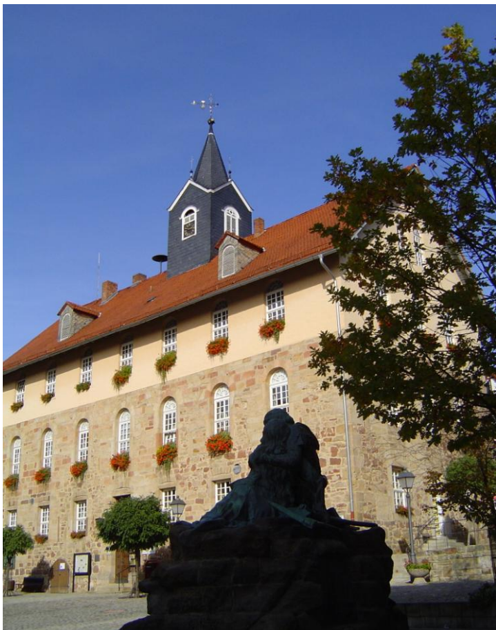
Rathausansicht im 21. Jahrhundert