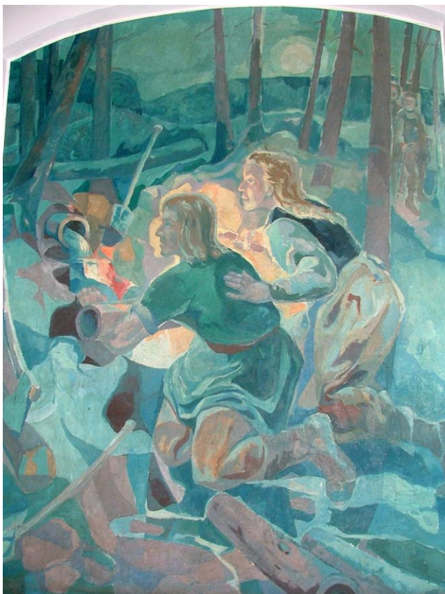
Abb. 6: Kuno und Else (Liebenbachsage)