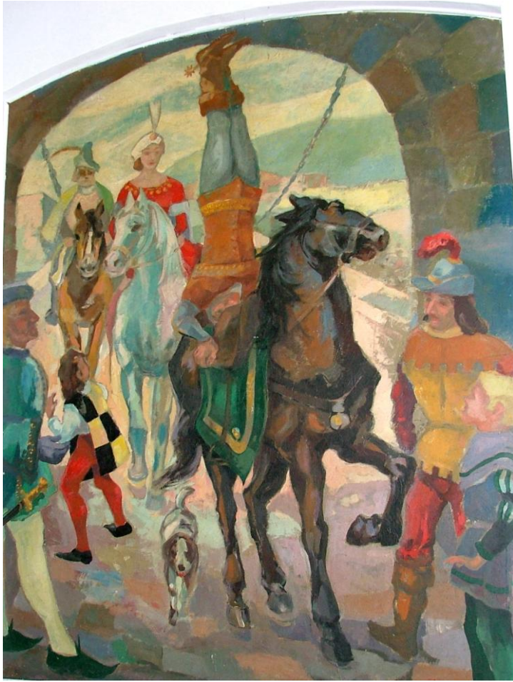
Abb. 9: Otto der Schütz reitet im Handstand durch das Burgtor