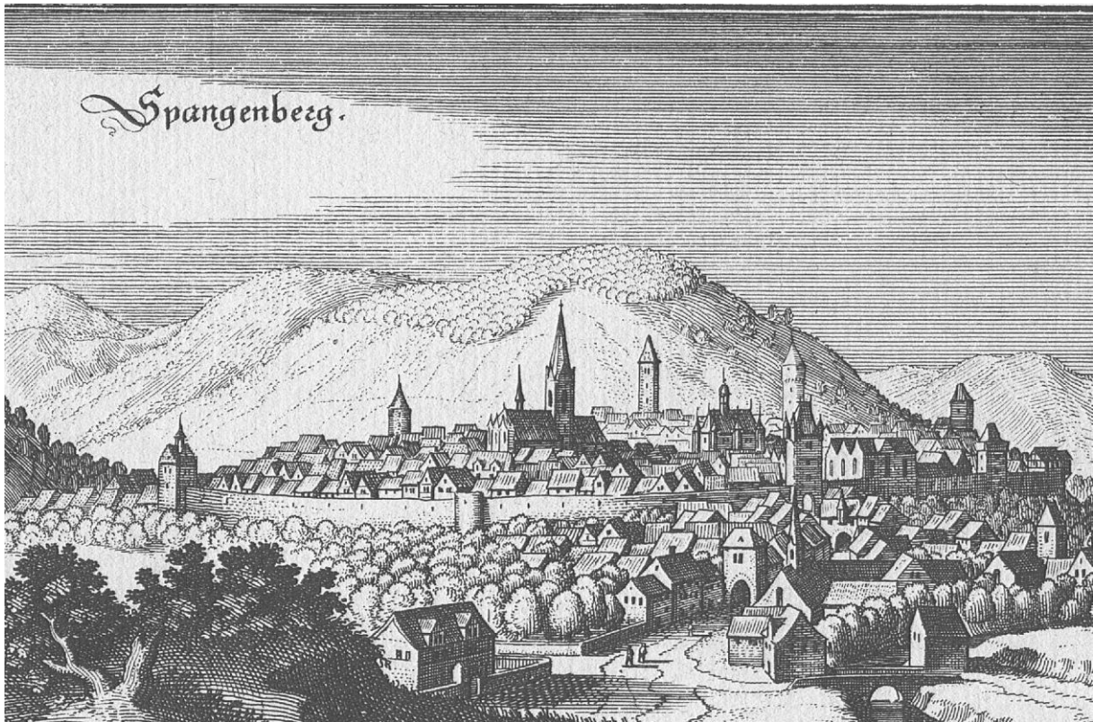
Abb. 1: Stich von Matthäus Merian von 1655