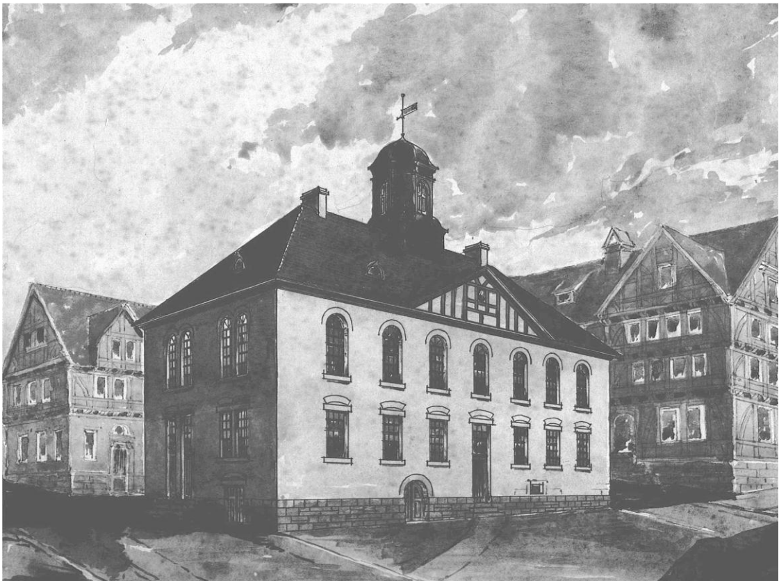
Abb. 4: Rathausansicht nach dem Umbau von 1820