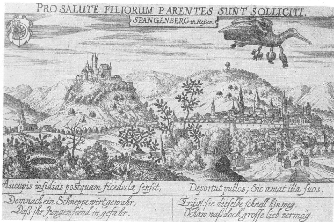
Abb. 2: Stich von Wilhelm Dilich/Daniel Meißner