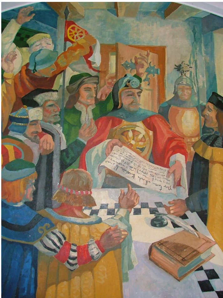
Abb. 8: Hermann von Treffurt erneuert den Spangenbergern die Stadtrechte am 5.8.1309