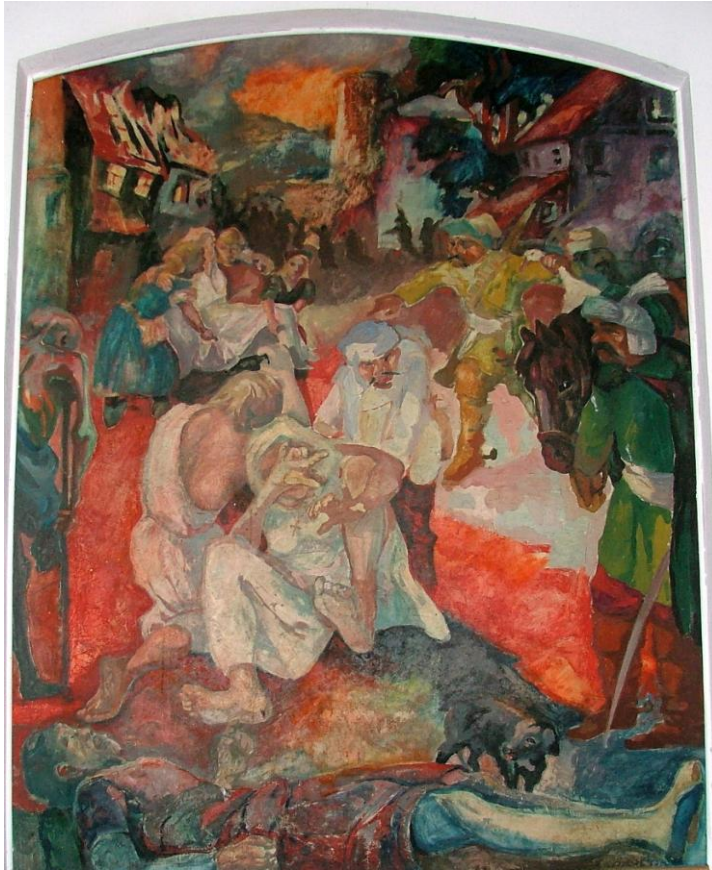
Abb. 7: Kroaten setzen 84 Häuser in Brand (1637)