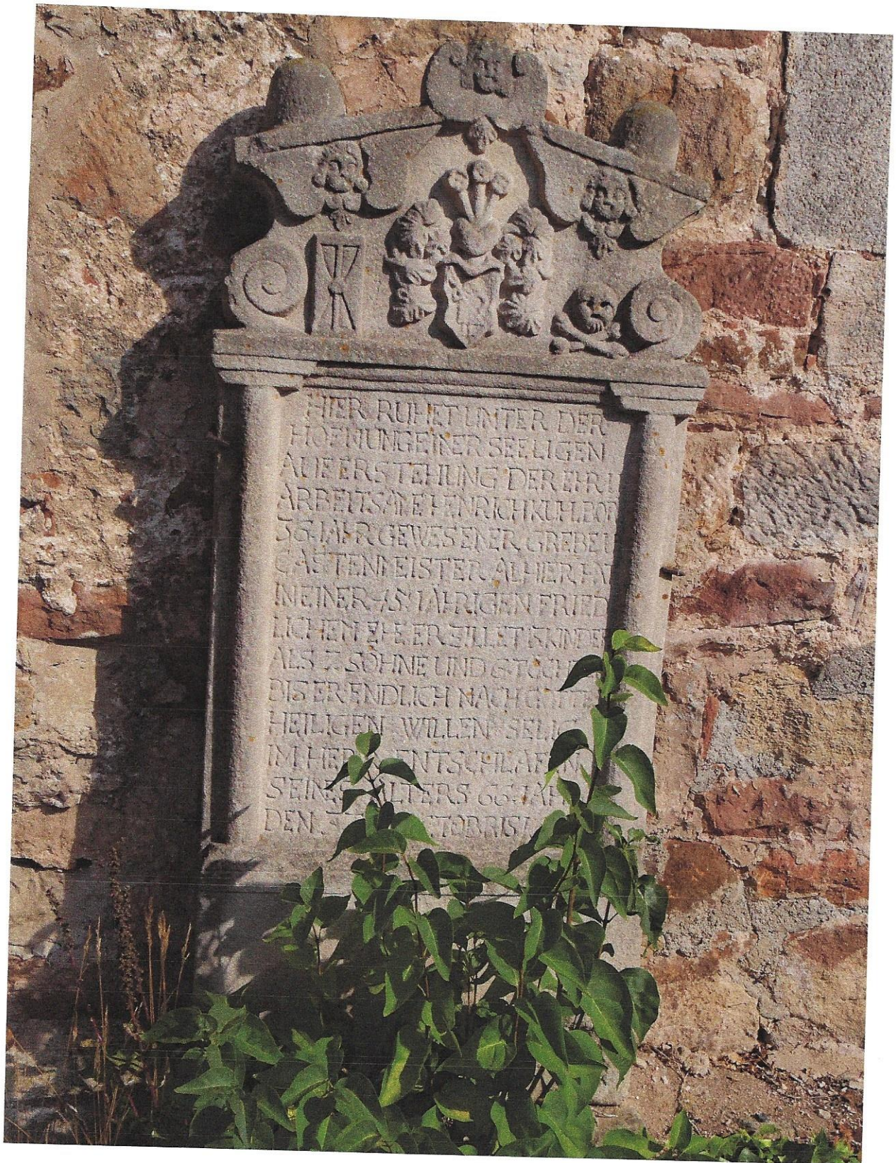
Grabstein an der Schnellroder Kirche des Heinrich Kühlborn †1690