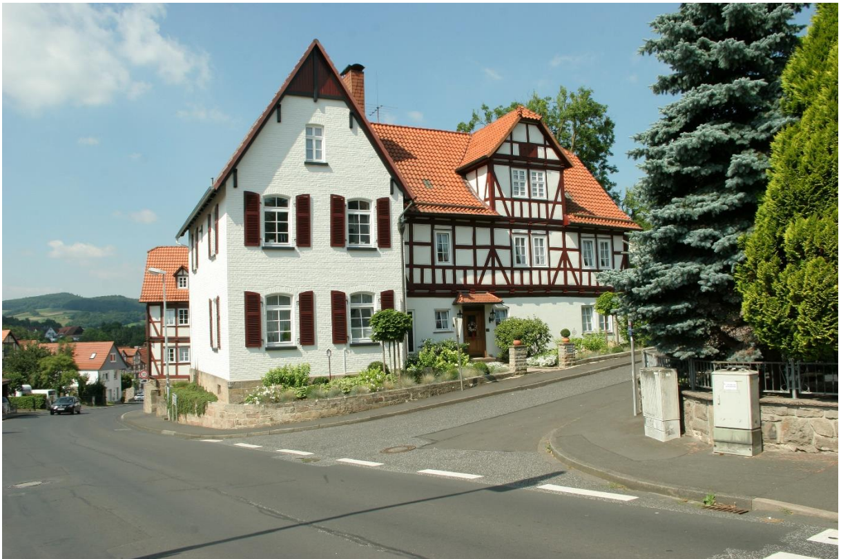
Ehemaliger Jägerhof in der Platzgasse