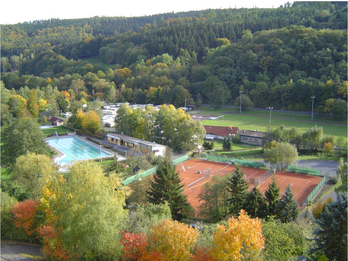
Sport- und Freizeitgelände