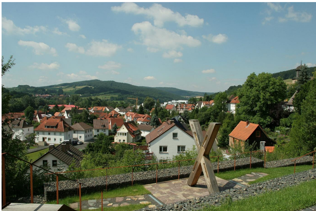
Eigene Scholle und Blaubach vom Schlossberg aus